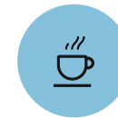
gemeinsames Kochen & Backen